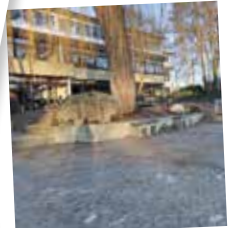
Innenhof d. Realschule Süßen