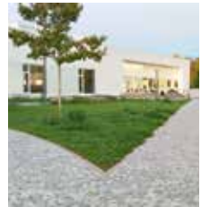
Kulturhalle Süßen (draußen)