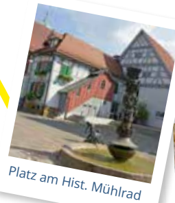
Platz am Hist. Mühlrad