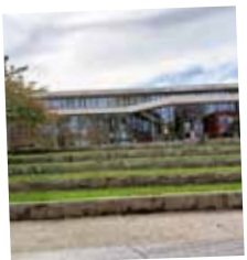
Bahnhof & Filsterrassen a. d. Stadthalle Eisingen