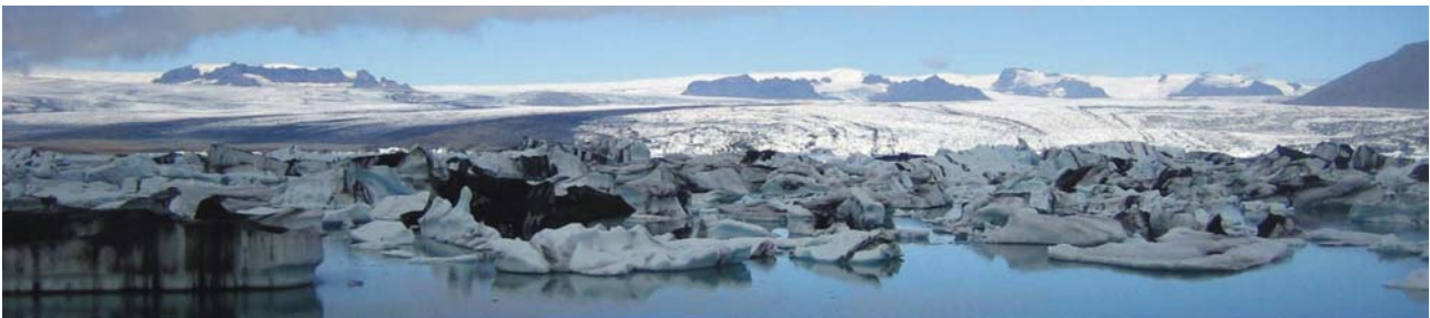
kalbende Gletscherzunge des Breiðamerkurjökull