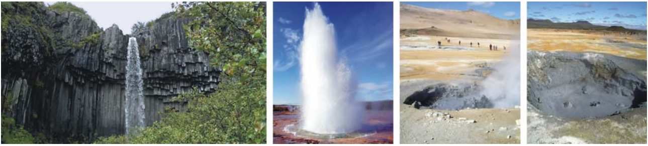
von links nach rechts: Wasserfall Swartifoss über Basaltsäulen herabfließend, Geysir Strokkur im Haukadalur, 2 x Hochthermalgebiet Namafjall

Enge, dunkle, spartanisch eingerichtete Torfhäuser waren vor allem im Winter ein äußerst beengter und unwirtlicher Lebensraum. Ganz im Gegensatz dazu wirkt das heutige Akureyri, das Zentrum des Nordens (etwa 18.000 Einwohner), bei einem unbedingt zu empfehlenden Besuch im botanischen Garten, bunt und einladend, mit fast südländischem Flair (Sonnenschein vorausgesetzt). Auch beim Spaziergang durch die kurze Fußgängerzone laden zahlreiche Cafés und Bars zum Verweilen ein. Informativ gestaltet ist das neue Kulturzentrum mit Tourismusinfo und kartografisch gut ausgestattetem Buchladen. Sollte ein Kreuzfahrtschiff am Pier liegen, ist die Stadt für die ausschwärmenden Kreuzfahrer erfahrbar zu klein. Übernachtung im Hotel Nordurland, Akureyri.