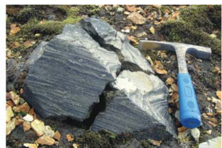
von links nach rechts: Gletscherzungen des Breiðarmerkurjökull und des Fjallsjökull, gesprengter Windkanter