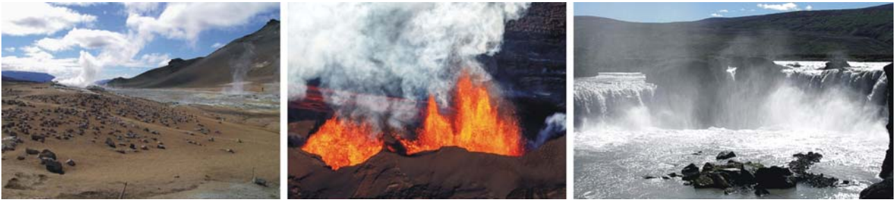
von links nach rechts: Furarolenfeld nördlich des Myvatn, Spaltenvulkan Bárðarbunga unter dem Vatnajökull (August 2014), Dettifoss

Ende des Berufjörður (Fjord), am Beispiel des Fossárvík, einem Hängetal und dem darin eingeschnittenen Wasserfall. Deutlich zu erkennen sind dabei die unterschiedlichen Auswirkungen von Eis und Wasser auf die Erosion. Übernachtung im Hallormsstaður (Ostisland).