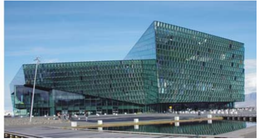
Reykjavik (von links nach rechts): Stadtansicht mit bunt angestrichenen Wohnhäusern, Hallgrímskirkja (1943-1986), Konzerthaus Harpa (2011)