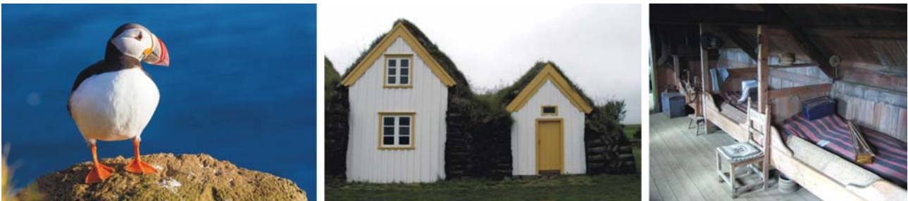
von links nach rechts: Papageientaucher, Dorfhäuser und Schlafkammer in einem Torfhaus im Norden Islands