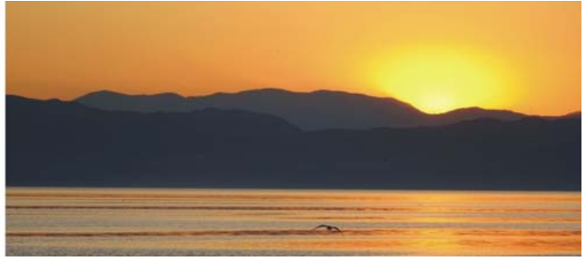
Altstadtbebauung von Ohrid und Abendstimmung am Ohrid-See

Besichtigungen der Altstadt von Ohrid (UNESCO-Welterbe) geplant, die mehreren großartigen Kulturen zu verdanken ist. Ohrid gilt als Perle unter den mazedonischen Städten. Bulgaren, Osmanen und Serben lebten hier Tür an Tür und regelten ihre Rechte als Minderheiten vertraglich - auf dem Balkan eher eine Seltenheit. Nach der illyrischen Stadtgründung im 8. Jh. v. Chr. geriet die Region zunächst unter makedonische, griechische und römische, im Mittelalter unter bulgarische und schließlich osmanische Herrschaft. Durch die Balkankriege vorübergehend serbisch, im 2. Weltkrieg wieder bulgarisch, danach jugoslawisch, ließen Ohrid auch im 20. Jh. bewegte Zeiten erleben. Seit 2005 erlebt die Stadt durch den Tourismus einen wirtschaftlichen Aufschwung (Abendessen und Übernachtung in Ohrid).