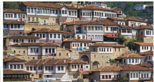
von links nach rechts: ausrangierte Diktatoren in einem Hinterhof, Moschee in Kruja, eng an den Berg geschmiegte Altstadt von Berat