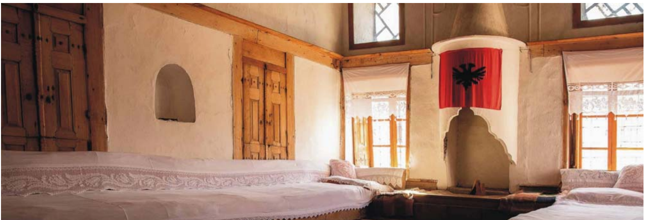
Wohnraum in einem traditionellen Bürgerhaus in Gjirokastra

Am Mittag Transfer zum Flughafen Tirana und Rückflug nach Frankfurt mit Lufthansa, Flug LH 1425, 13:40-16:00 Uhr und Rückfahrt mit dem Zug zum Heimatort (bei Zubuchung von Rail&Fly).