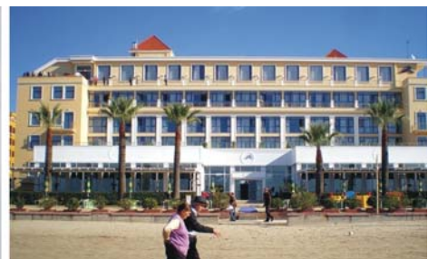
links nach rechts: Sv. Naum am Ohrid-See / Mazedonien, Via Egnatia in Elbasan, Hotel Adriatik an der Adria in Durres