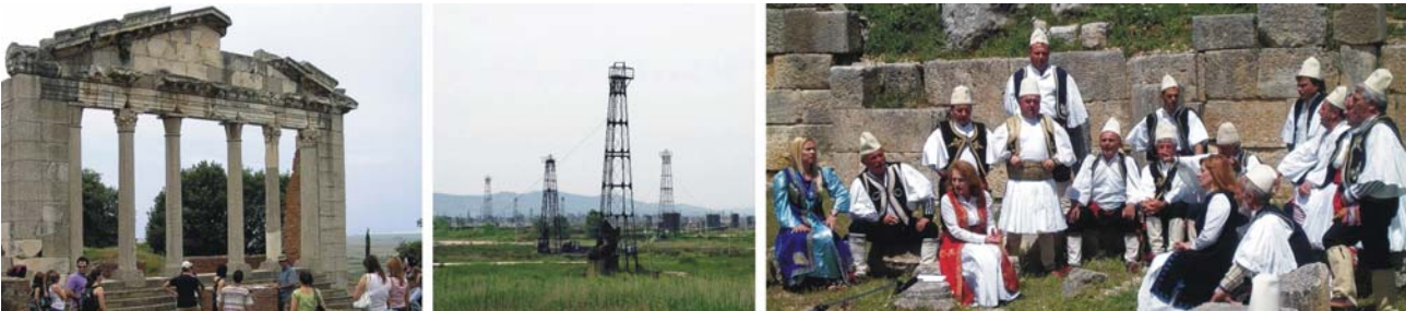
von links nach rechts: Ausgrabungsort Apollonia und Erdölfeld bei Fier, Folklore im römischen Theater von Bylis

Unterkünfte: **** Hotel Brillant in Saranda / Albanien (oder vergleichbar) *** Hotel Alvero in Permet / Albanien (oder vergleichbar) *** Pension Vila Falo in Voskopja / Albanien (oder vergleichbar)